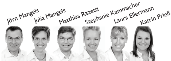
Stand: Januar 2012 Alle bisherigen Preislisten verlieren ihre Gültigkeit.

Kirchenstraße 24 27711 Osterholz-Scharmbeck Tel 04791-985151 Fax 985152 besuchen Sie uns im Internet www.fotoscheune.de